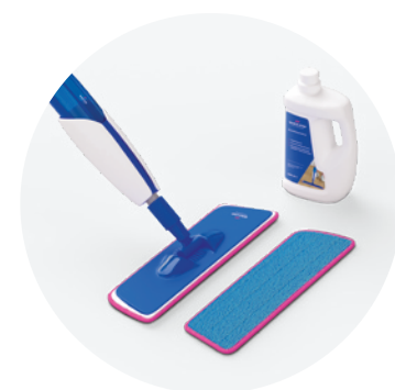
Kit de limpeza QSSPRAYKIT

Este produto de limpeza foi especificamente desenvolvido para os pavimentos Quick-Step. Limpa rigorosamente as superfícies e protege o aspeto original dos pavimentos, maximizando a experiência de ter um "pavimento novo".