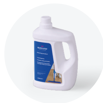
Produto de limpeza de 1 L ou 2,5 L QSCLEANING1000 QSCLEANING2500

Este produto de limpeza foi especificamente desenvolvido para os pavimentos Quick-Step. Limpa rigorosamente as superfícies e protege o aspeto original dos pavimentos, maximizando a experiência de ter um "pavimento novo".