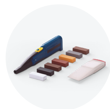
Kit de reparação QSREPAIR

Uma mopa em microfibras robusta, lavável na máquina até 60 °C. Esta mopa é compatível com o kit de limpeza Quick-Step.